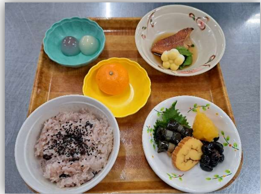
1月1日 赤飯 おせち